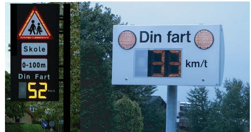
Din Fart enhed i henholdsvis Århus modellen og den traditionelle.